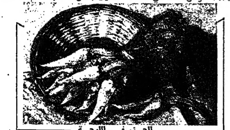
الجزر في اللوحة

وكان فرج ٧٠ سنة « بين هؤلاء الطلاب الفنانين طالبا جادا ثم اعماله في عهد المدرسة من موهبة لغفت انظار اساتذته واهله وتخرج عام ١٩٣٤ ، وتال ميدالية صالون القاهرة البرونزية عام ١٩٣٤ ، وكان استاذ في هذا